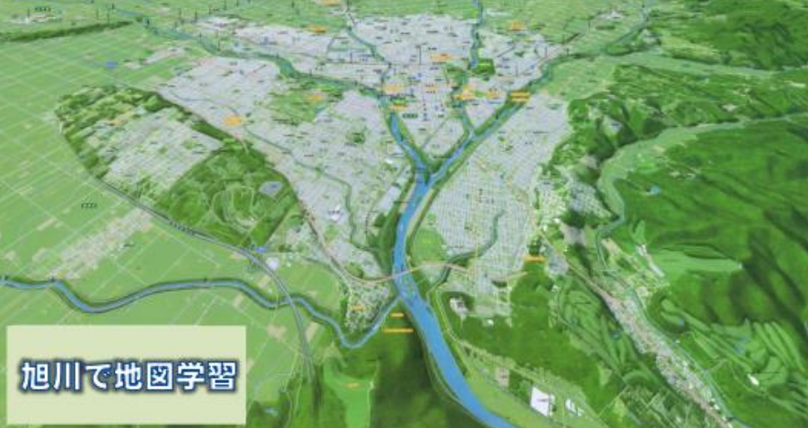
「VISTA MAP 旭川」 2007国際地図会議 「余暇とオリエンテーリング地図部門 最優秀賞」

北海道地図株式会社は地図専門メーカーとして多種多様な地図を制作している全国でも有数の企業です。官公庁のオーダーで制作する地図や、教育現場で利用される地図は北海道地図で制作されているものが多く、各学校における社会科の学習と密接に関係しています。特に近年は「ジオパークネットワーク」との連携・協力をおこなっており、日本ジオパーク・ショールームとしてジオパークに関する様々な資料が展示されています。また、地図の制作工程の見学も可能となっており、ペーパークラフト立体マップの制作等が体験できることから【見学・体験・体感】の総合学習が可能となります。